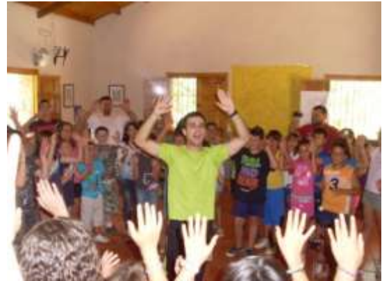
Jugando al Curro

La comida fue: 1º plato lentejas, 2º alitas de pollo y de postre melón.