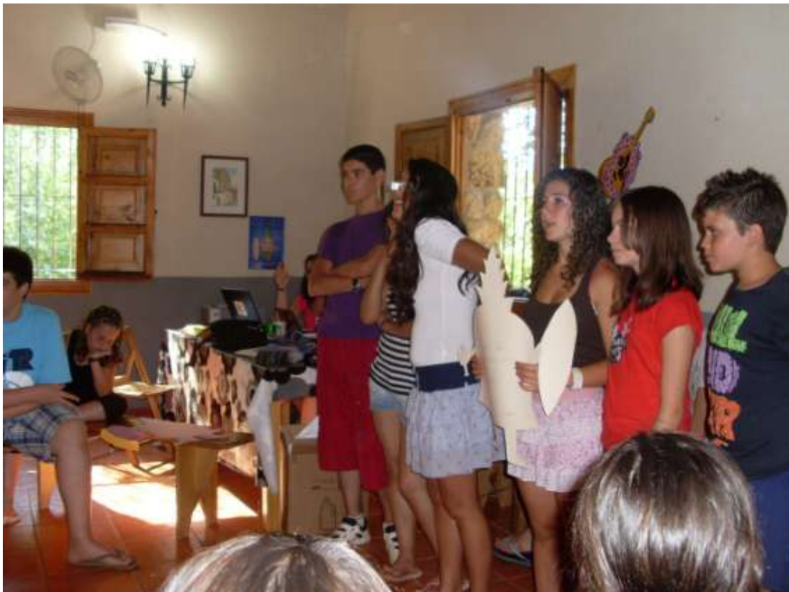
El grupo de los mayores aclarando las dudas y escuchando las valoraciones de los otros niños.

Al exponer sus propuestas estas eran aclaradas y cuestionadas por el conjunto de los participantes.