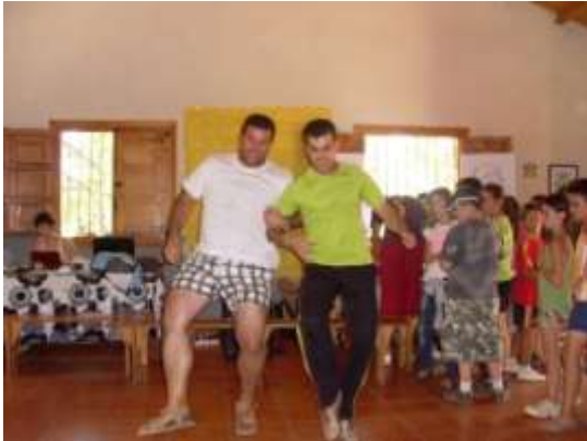
Parece ser que se lo pasaron muy bien

El trabajo se alargó y no había tiempo para la piscina, así que se substituyó por unos momentos juegos