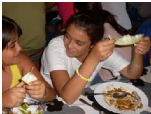
Marta se comió solamente tres alitas