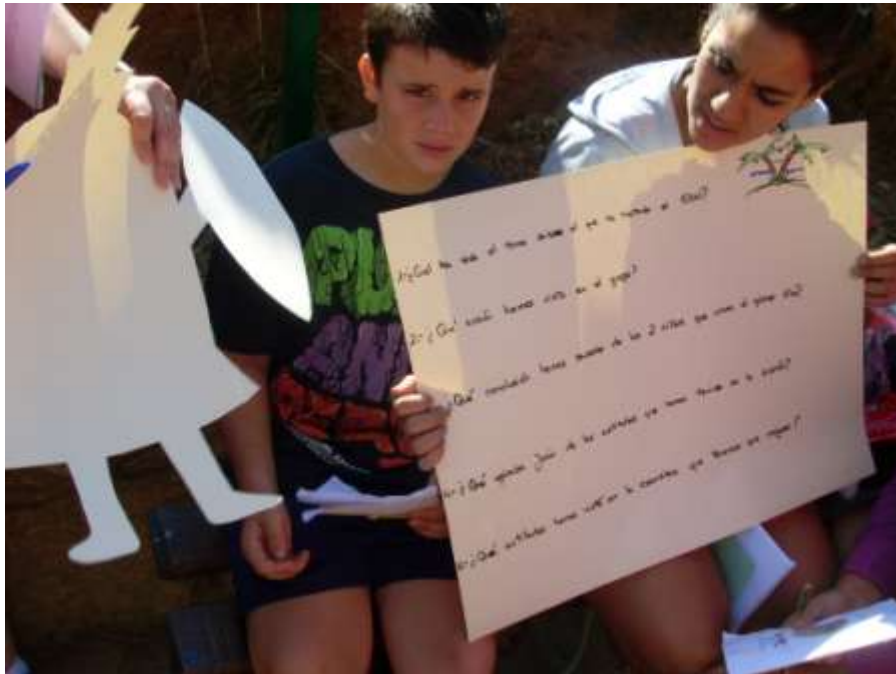
Momento en el que comenzaban su trabajo sobre el Transformar

Los representantes de la coordinadora y el jefe de día comunicaron el horario, dieron algunas normas y explicaron el contenido del día que iba a tener dos momentos importantes: La decisión del Sacrificio Final (buscar compromisos y acciones después de todo lo tratado) y la Maldición del Gurú (preparar el trabajo de los 3 niños del JUNIOR en el encuentro del MIDADEN en Suiza dentro de dos semanas)