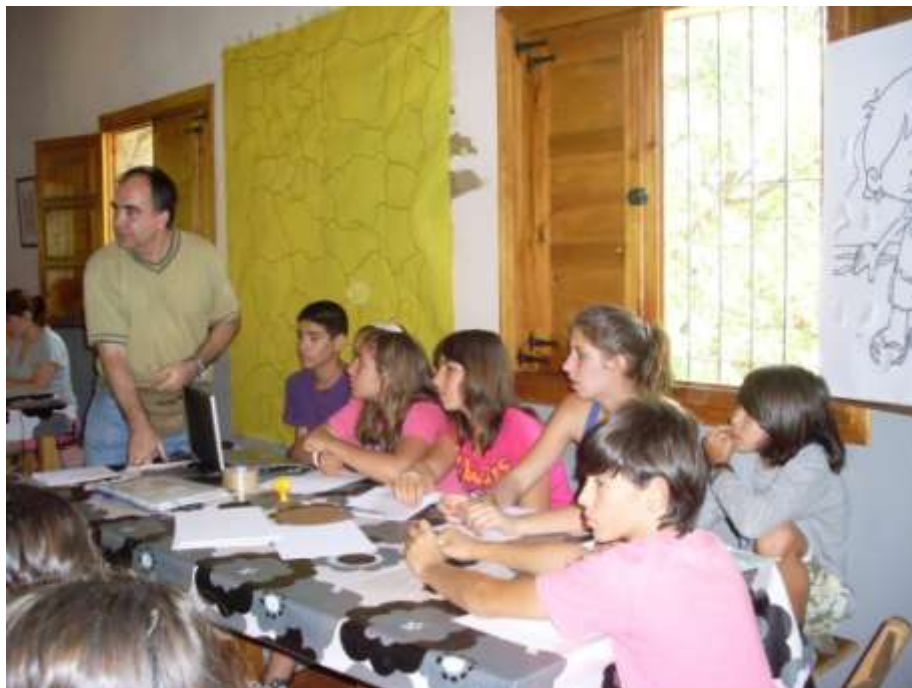
El mapa de España sirvió para preparar nuestra intervención en Suiza.