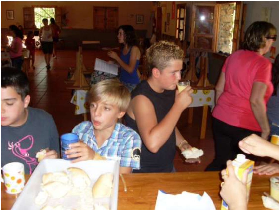
Jesús ¿Qué quieres? Zumo o natillas

Después del manguerazo, que substituyó a piscina y ducha, una rica y variada merienda