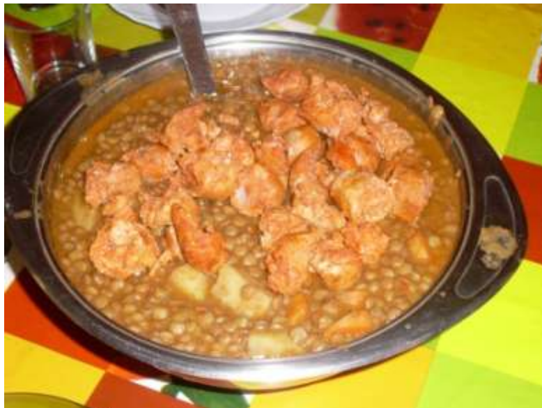
Lentejas para exponerlas en un museo

La comida fue: 1º plato lentejas, 2º alitas de pollo y de postre melón.