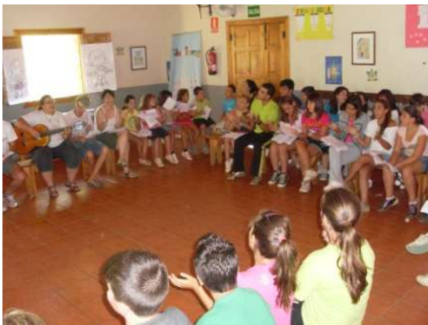
¿Quién cantara y tocara como Ana?

Los buenos días, fueron un poco más participativos que el día de ayer. Y aunque los ensayos de las canciones de la oración se alargaron un poquito, comenzamos muy bien día.