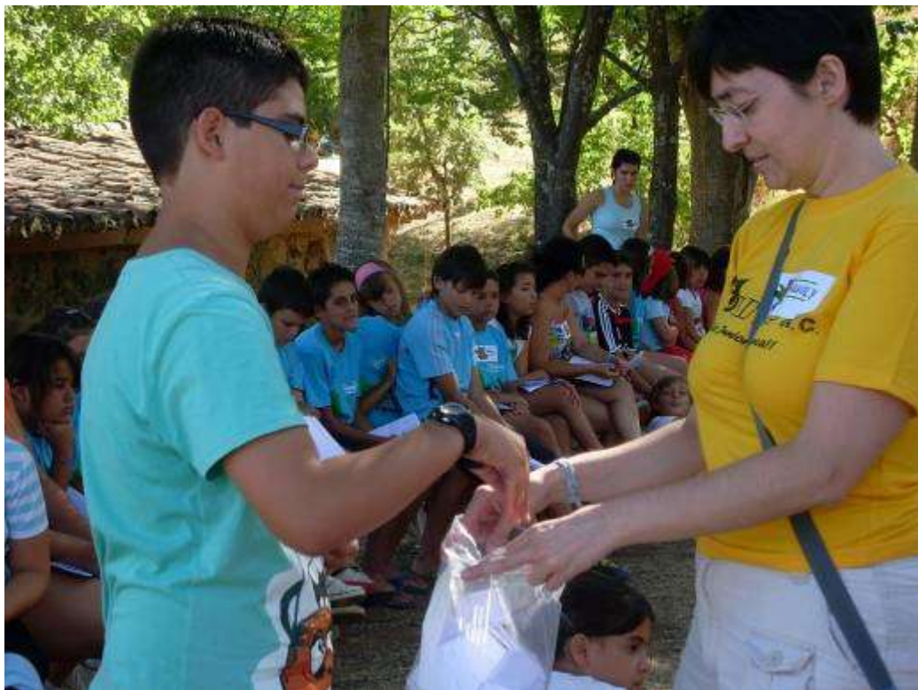
Los participantes en el encuentro eligen el papelito en el que va escrito el nombre del que será su amigo invisible.