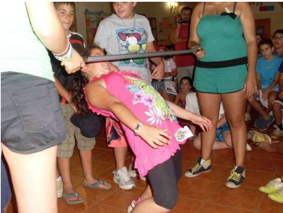
A este juego le llaman la cucaracha.

Para ello se hacía juegos en los que se decidía quién comenzaba a explicar lo que habían reflexionado.