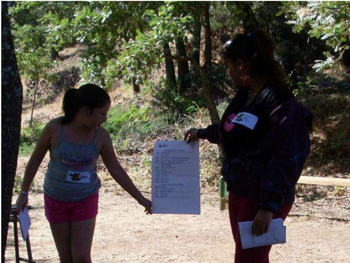
Miembros de la coordinadora presentando lo que se iba a hacer durante todo el día.