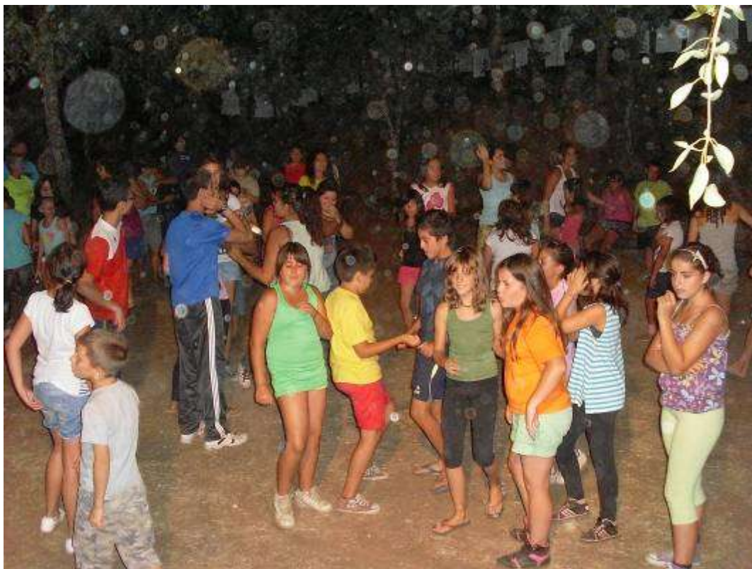
Momento final del jueves. Había mucha marcha